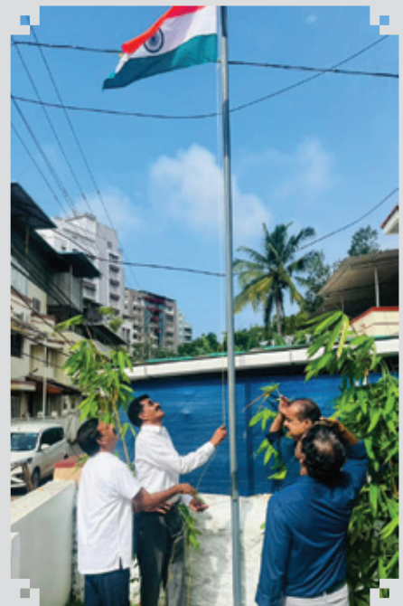
79-ാം സ്വാതന്ത്ര്യദിനത്തോട് അനുബന്ധിച്ച് KSSIA സംസ്ഥാന - റീജിയണൽ - ജില്ലാ ഓഫീസുകളിൽ സംസ്ഥാന പ്രസിഡന്റ്, സംസ്ഥാന വൈസ് പ്രസിഡന്റുമാർ പങ്കാക ഉയർത്തുന്നു.