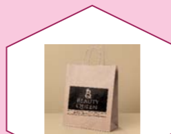
BROWN PAPER BAG ( WITH HANDLE )