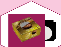
CAKE BOX & BASE