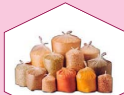
GROCERY BAGS ( 500g, 1 kg, 2 kg 3 kg, 5 kg, 10 kg)

FOR ENQUIRIES FEEL FREE TO CONTACT US AT : +91 8606096166 ,9447700603