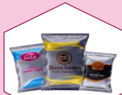
SNACKS COVERS (MIXTURE, CHIPS, BURKY, MURUKKU ETC.)