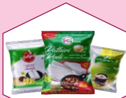
COVERS FOR POWDER PACKING (ATTA, MAIDA, CHILLY POWDER, CORIANDER POWDER)