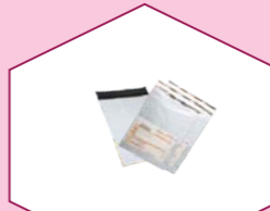
COURIER COVERS WITH OR WITHOUT POD