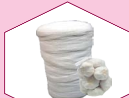
FRUITS VEGETABLES NET