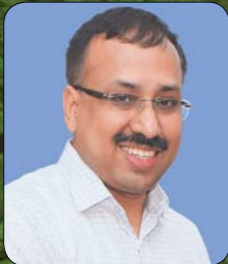
എസ്. ഹരി കിഷോർ ഐ.എ.എസ്