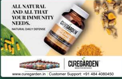
"Our speciality ingredients are the result of supercharging nature through scientific innovation."