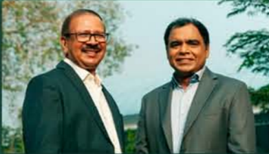
"A winning combination of intellectual and industrial strength."