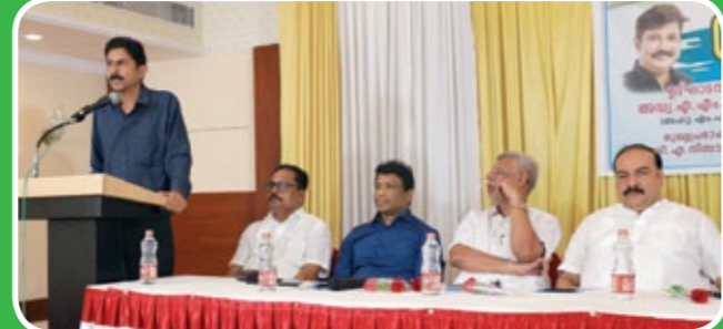
സംസ്ഥാന പ്രസിഡന്റ് എ.നിസാറുദ്ദീൻ മുഖ്യപ്രഭാഷണം നടത്തുന്നു.