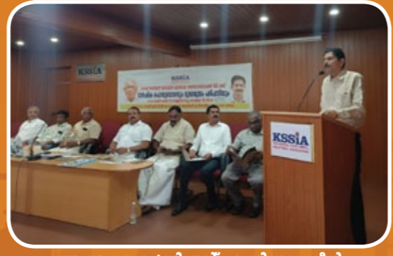
സംസ്ഥാന പ്രസിഡന്റ് എ.നിസാറുദ്ദീൻ അദ്ധ്യക്ഷ പ്രസംഗം നടത്തുന്നു.