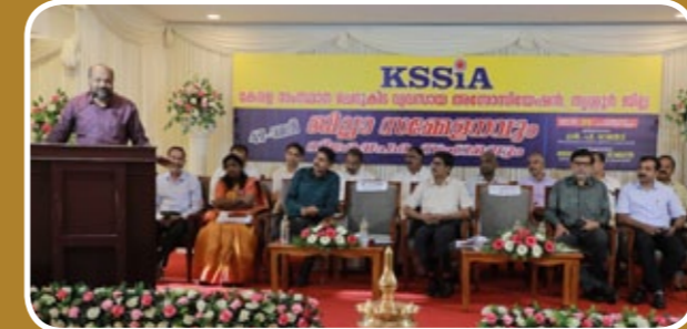
കെ.എസ്.എസ്.ഐ.എ. തൃശ്ശൂർ ജില്ല വാർഷിക പൊതു യോഗത്തിൽ ബഹു.വ്യവസായ നിയമ കയർ വകുപ്പ് മന്ത്രി പി. രാജീവ് ഉദ്ഘാടന പ്രസംഗം നടത്തുന്നു