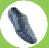
ART NO : 9110