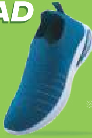
ART NO : 782