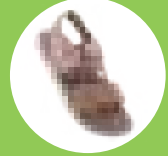
ART NO : 8302