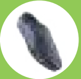
ART NO : 9115