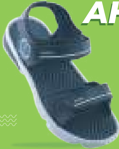
ART NO : 940